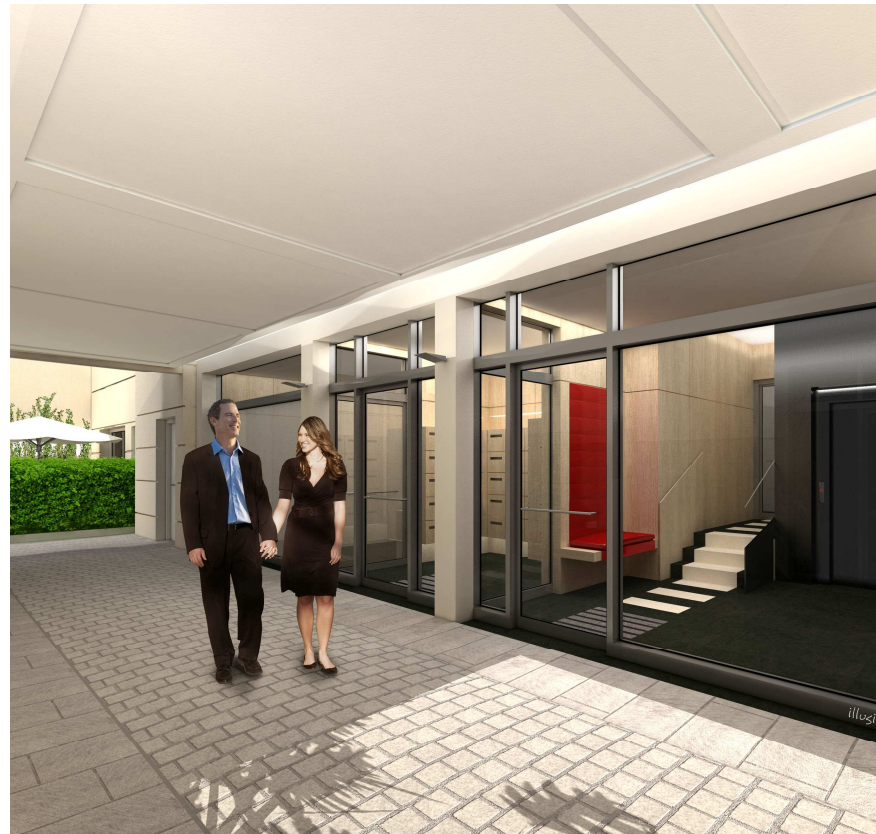
A gauche, l'œuvre d'Alban Morinière qui sera exposée dans le hall de la résidence Jardin d'écriture, Paris 13 ème ardt